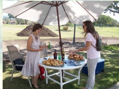
CFCCI/Embajada de Francia