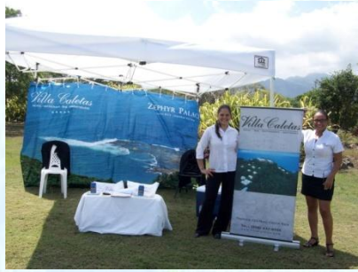
Hotel Villas Caletas